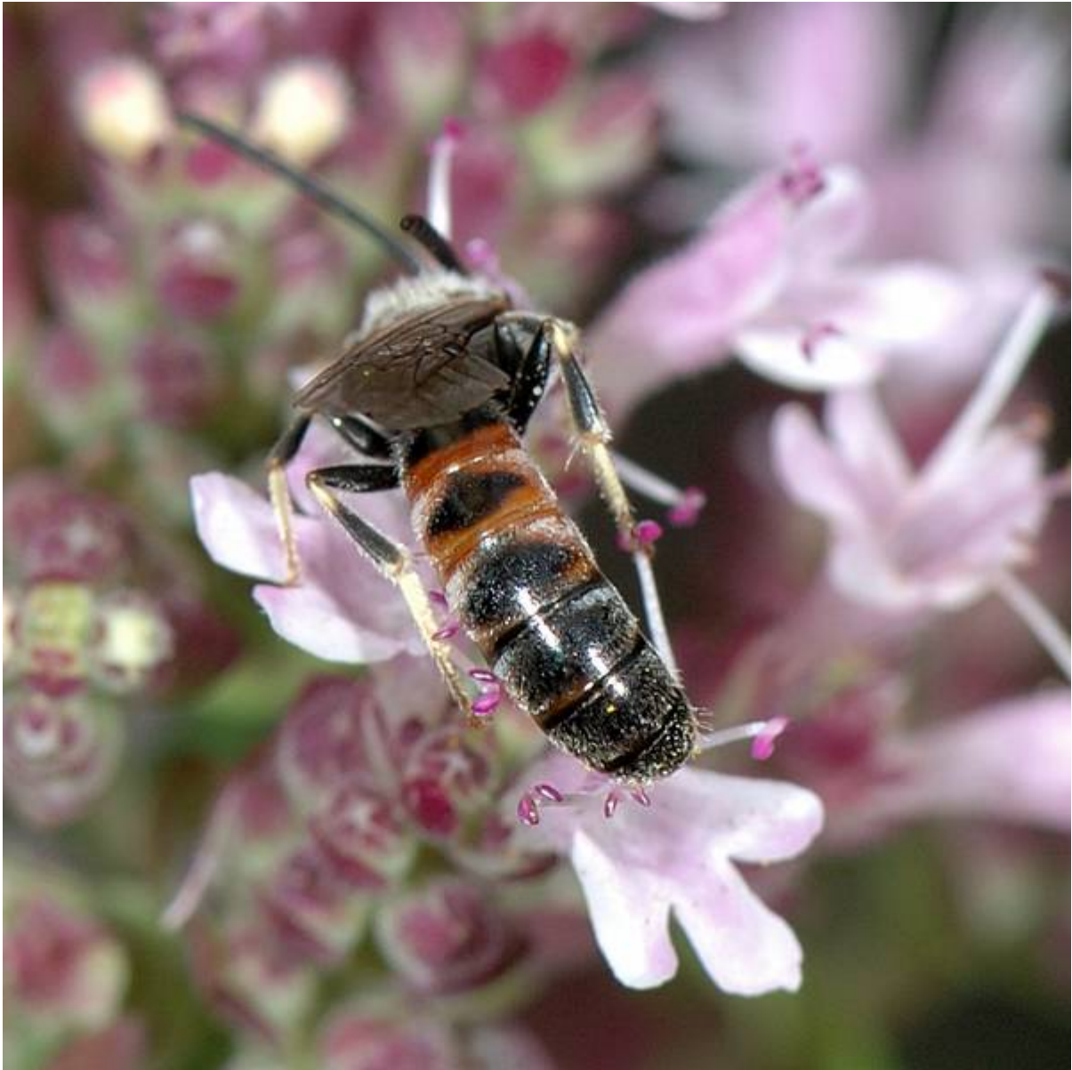
mâle de Lasioglossum