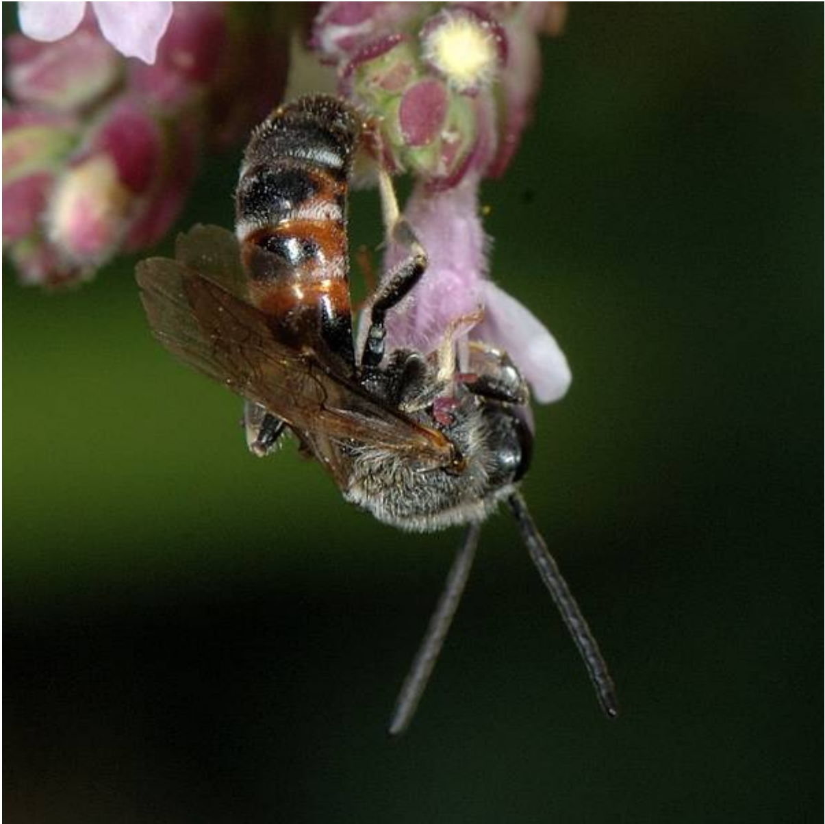
mâle de Lasioglossum